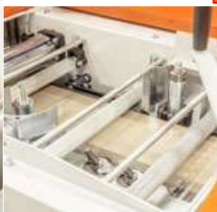
5 st matarvalsar