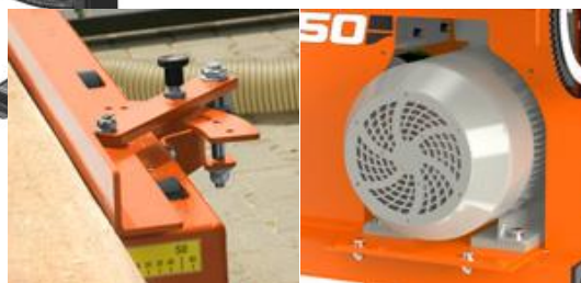
Justerbart anhåll 15 kW / 18,5 kW motor

Moms och frakt tillkommer på alla priser. 11,10 € 2023-01-15