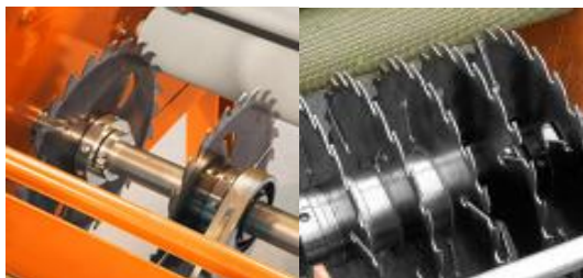
Dubbla klingor 5 st klingor - Lamellsåg